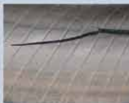
Innerliner brud igennem sidevægs forstærkning