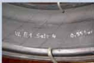
Klare synlige striber med rynker