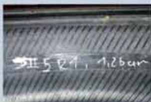
Ingen synlig skade