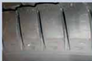
Markant slid af skulderkant