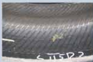
Ingen synlig skade