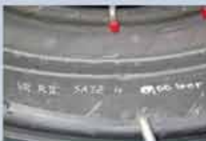
Klare synlige områder med rynket innerliner