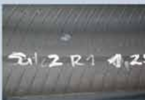
Mørk stribe men ingen synlig skade