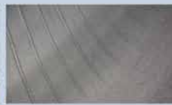
Mørke brede striber