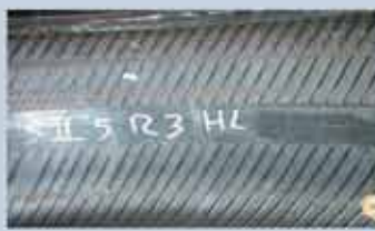
Synlige lyse striber i flexzonen