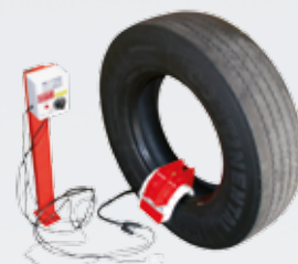
517 4170 her vist med stander