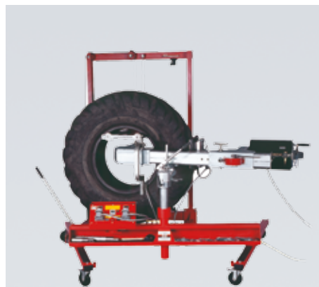
517 7701 vist med stander 517 3554